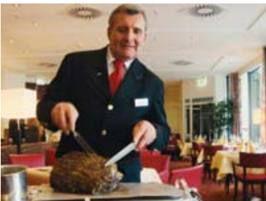
Restaurant-Telefon: (0201) 1007-165

Jeden Abend: „Original US Prime Beef“ vom Christofle Wagen