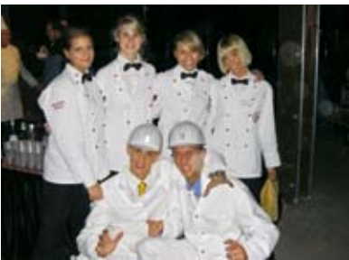
Wir kommen zu Ihnen...

Wir „catern“ bei Ihnen in Essen's schönsten Locations. Die „Sheraton Bergleute“ freuen sich auf Ihre Anfrage.