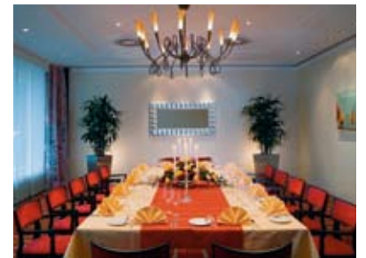
Bankett-Telefon: (0201) 1007-170

Unsere Privaträume stehen Ihnen für exklusive Veranstaltungen mietfrei zur Verfügung.