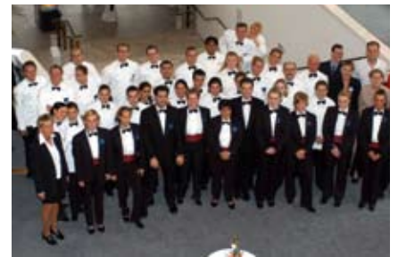
Catering-Telefon: (0201) 1007-170

Auch für Ihre Party zu Hause. Wir betreuen Sie für 800 oder mehr Gäste.